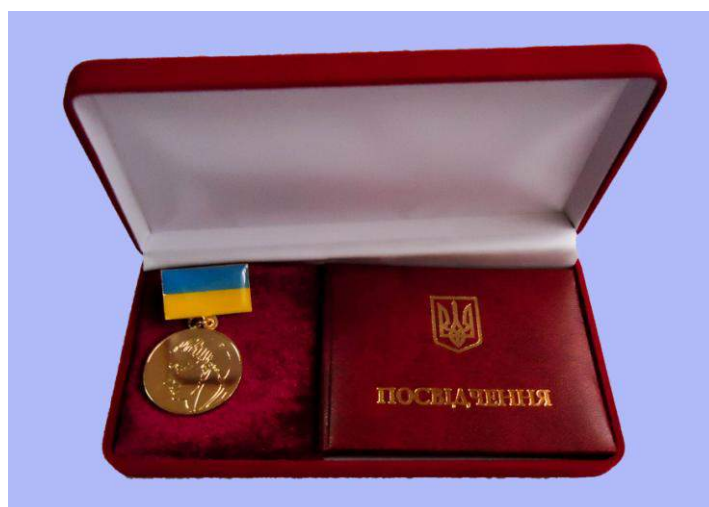
Медаль Г.С. Сковороди (ДВНЗ «Переяслав-Хмельницький державний педагогічний університет імені Григорія Сковороди»)