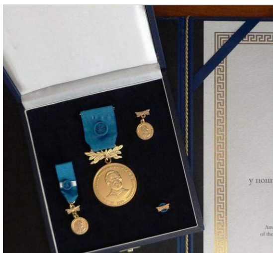
Медаль «За Значний внесок у поширення ідеї єдності Європи»